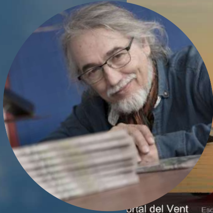
Portal del Vent Escultor: Teo San José